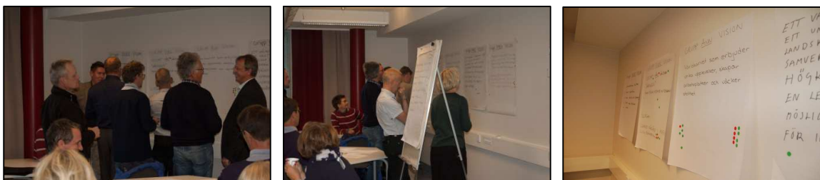
Bild 1-3. Visionering och prickotering

Deltagarna fick därefter som uppgift att från de åtta gruppernas förslag rösta fram de två bästa visionerna. Röstningen var individuell. Varje deltagare fick tre poäng i form av klistermärken att dela ut såsom de önskade: alla tre poäng kunde läggas på en och samma vision eller delas mellan olika. Deltagarna fick även rösta på sitt eget alster. Resultatet från uppgiften ses i tabell 1. De två bästa alternativen förs vidare till strategiarbetsgruppen och senare delegationen för att användas som utgångsläge i arbetet mot att enas om en ny, gemensam vision.