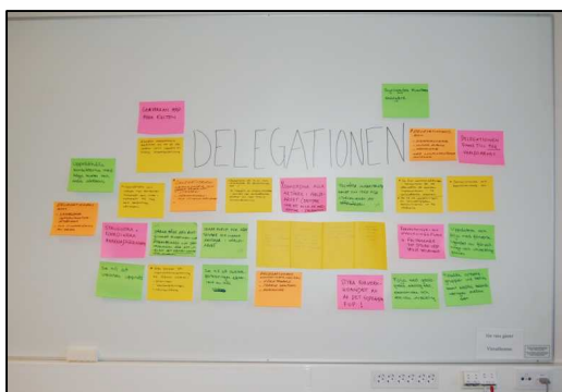
Bild 4. Presentation av uppgifter

Grupperna fick som uppgift att göra en lista över tio uppgifter de anser delegationen ska ha, och vara så konkreta som möjligt. Grupperna ombads ta i beaktande de uppgifter delegationen nu har men även de åsikter som framfördes vid föregående workshop. Av de tio uppgifterna ombads grupperna speciellt lyfta fram tre viktigaste. Resultaten ses i tabell 3.