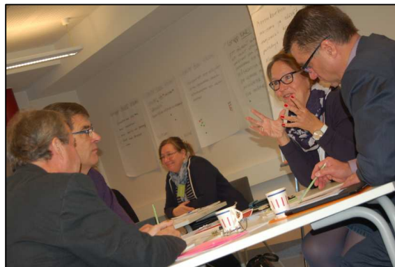
Bild 5-6. Inspiratörer och skeptiker.

Delegationen har tidigare haft flera mindre arbetsgrupper, men de flesta är inte längre aktiva. Deltagarna upplevde att det finns ett stort behov att få igång grupperna igen, t.ex. en infragrupp med uppgift att samordna infrastrukturåtgärder. Det konstaterades att det nu vore viktigt att se över delegationens sammansättning för att garantera verkställandet. Att skapa mindre grupper som behandlar en viss typ av ärenden skulle också ge ett effektivare arbete.